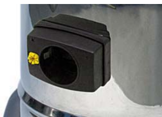
Válvula de entrada central em plástico condutor Central-mounted inlet valve in conductive plastic

EX II 3D Ex tc IIIB T200°C Dc IP6X/IP54 certified. Structure and collection tank in Stainless Steel 430, and vacuum gauge for checking the filter clogging. Tested HEPA (H14) filters upstream and downstream the motor for filtering the cooling air and exhaust air, allowing full safety, designed for the most applications in ATEX or explosion risk areas, ensuring top safety and comfort for the user.