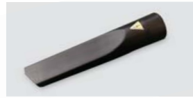
323314A Lança fina de plástico condutor Ø 32mm / Ø 32mm conductive plastic flat lance