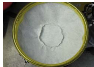
Filtro principal condutor Conductive main filter