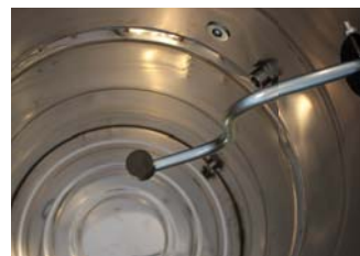
Sistema interno com filtro manual oscilante lateral Side-mounted manual filter shaker internal system