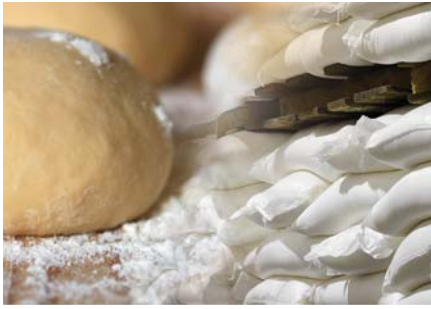
ALIMENTAR / FOOD INDUSTRY