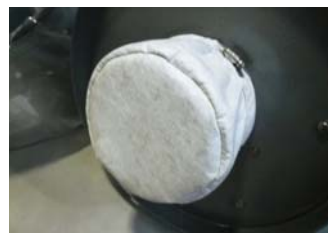
Filtro HEPA testado 99,995% a 0,3µ com proteção HEPA filter 99,995% tested on 0,3µ with protection prefilter