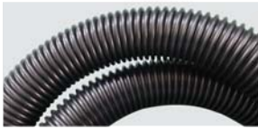
383440D Tuboflex condutor Ø 38mm para união condutora Ø 60mm / Ø 38mm conductive hose assembly for Ø 60mm conductive inlet