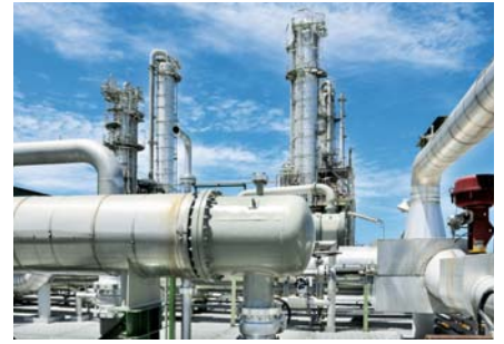
INDÚSTRIA QUÍMICA / CHEMICAL POWDER INDUSTRY