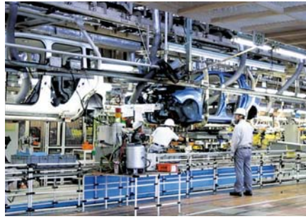
INDÚSTRIA AUTOMÓVEL / AUTOMOTIVE INDUSTRY