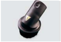
323312A Escova redonda em plástico condutor Ø 32mm / Ø 32mm conductive plastic round brush