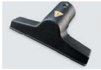
323313A Bocal pequeno em plástico condutor Ø 32mm / Ø 32mm conductive plastic small tool