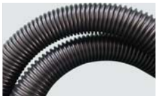
500711 Tuboflex condutor para bocal condutor Ø 60mm / Conductive hose assembly for Ø 60mm conductive inlet