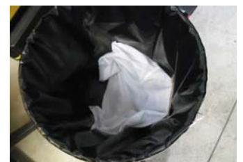
Lotes de recolha e eliminação condutora Conductive dralon and polyliner bags