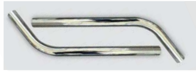
381477 Tubo cromado duplo Ø 38mm / Ø 38mm chromed double wand