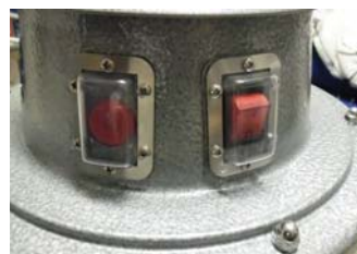
Indicador luminoso de saturação de filtração Filtration and flow control system