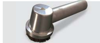
501184A Escova de alumínio com cerdas condutoras Aluminium dusting brush with conductive bristles