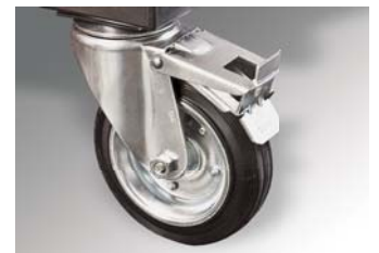
Rodas com travões Braked wheels