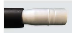
381155A Adaptador cónico em alumínio Ø 38-32mm / Ø 38-32mm aluminium tapered reducer