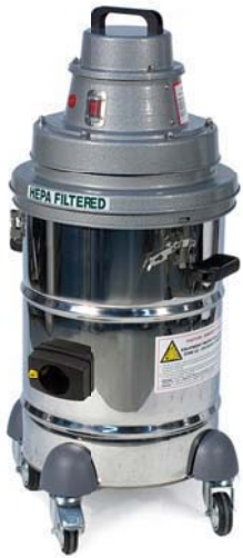
Planet 22 S ATEX