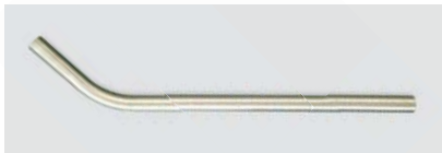
500160 Tubo curvo em alumínio Aluminium single wand