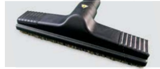
381448A Escova de pavimentos Ø 38mm em plástico condutor com cerdas condutoras de nylon / Ø 38mm conductive plastic floor tool with conductive nylon bristles