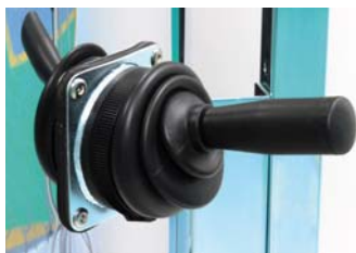
Filtro manual oscilante lateral Side-mounted manual filter shaker