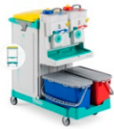
Magic System 850V