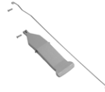
Pedal set for Magic bag holder