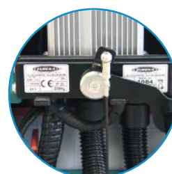
Carregador de baterias