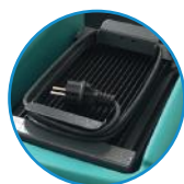
Carregador de baterias