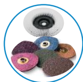
Escovas e discos