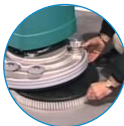
Escovas e Discos