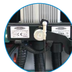
Carregador de baterias