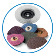
Escovas e discos