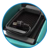
Carregador de baterias