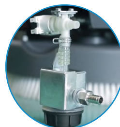
ESCS: Válvula de controle de paragem Eureka