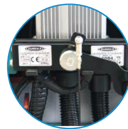
Carregador de baterias