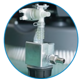
ESCS: Válvula de controle de paragem Eureka